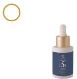
Serum Vitamina C