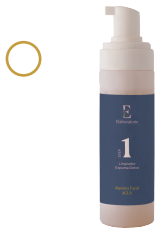
Limpiador espuma detox

No te agobies si no llegas a coger todos los apuntes. ¡En este dossier encontrarás todo por escrito!