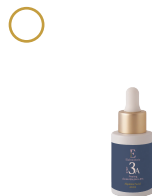
Peeling ácido glicólico 8%