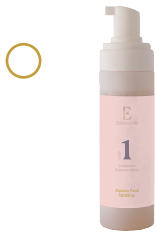
Limpiador espuma detox

Hilos de fibroina autoabsorbibles y sin aguja