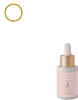
Peeling ácido glicólico 8%