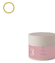
3 Mascarilla descongestiva