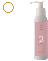
2 Loción oxigenante