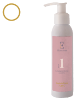
1 Limpiador leche nutritiva

Tratamiento para contraer la piel a través de microcauterizaciones.