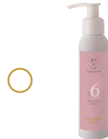
6 Mascarilla lifting

¿QUÉ PROBLEMAS SOLUCIONAMOS CON ESTA ALQUIMIA?