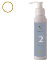
2 Loción oxigenante