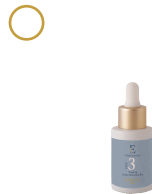
3 Peeling ácido glicólico 8%