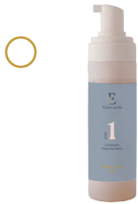
1 Limpiador espuma detox

¡Revisa que los tengas todos en el Welcome Pack!