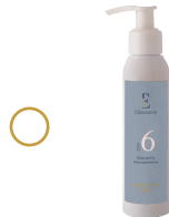
6 Mascarilla hidroproteína

○ + 4 productos para cliente final: Serum y Crema Orange Blossom Serum oxigenante y crema reafirmante